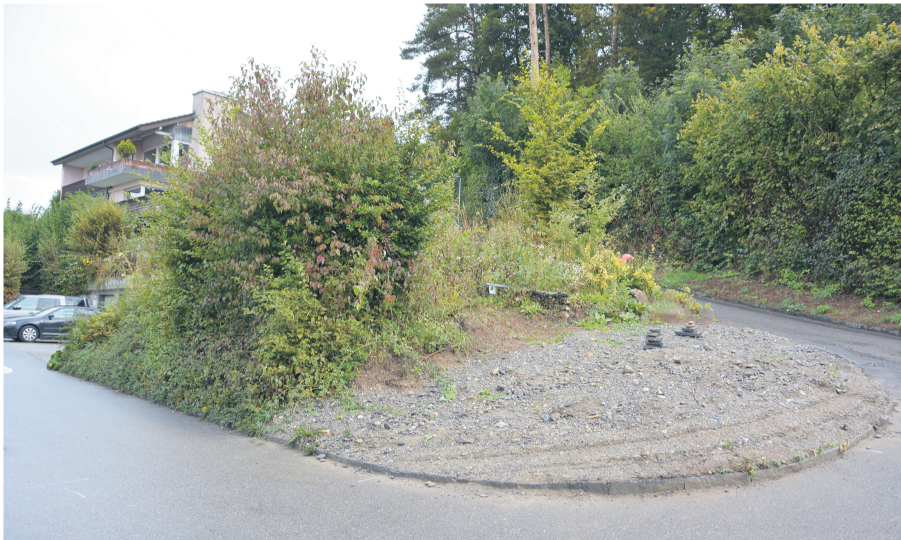
Auf dieser Kiesfläche soll künftig ein Brunnen stehen. Links davon ist eine Trafostation geplant.