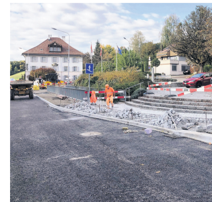
Die Kantonsstrasse in Eggenwil wird zurzeit komplett saniert.