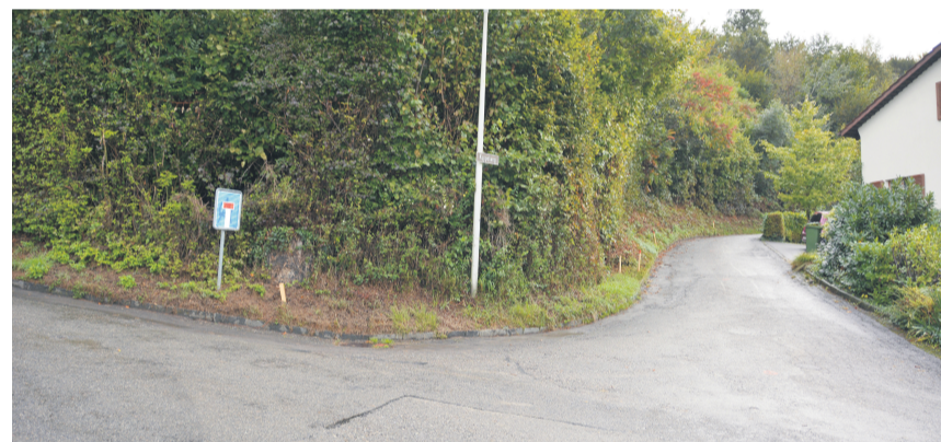
Der Kuppelweg (rechts) wird 2022 bergseitig verbreitert. Dafür muss der Hang nach hinten weichen.

bau und die Sanierung des nahen Kuppelwegs auf. Dafür sind rund 1,9 Millionen Franken vorgesehen. Bergseitig ist hier das Gelände sehr steil, hangseitig stehen Häuser. Die durchgehende Verbreiterung der Quartierstrasse auf 3,5 Meter erfolge deshalb bergaufwärts. «Für die Bauarbeiten muss der Wald auf einer Flä-