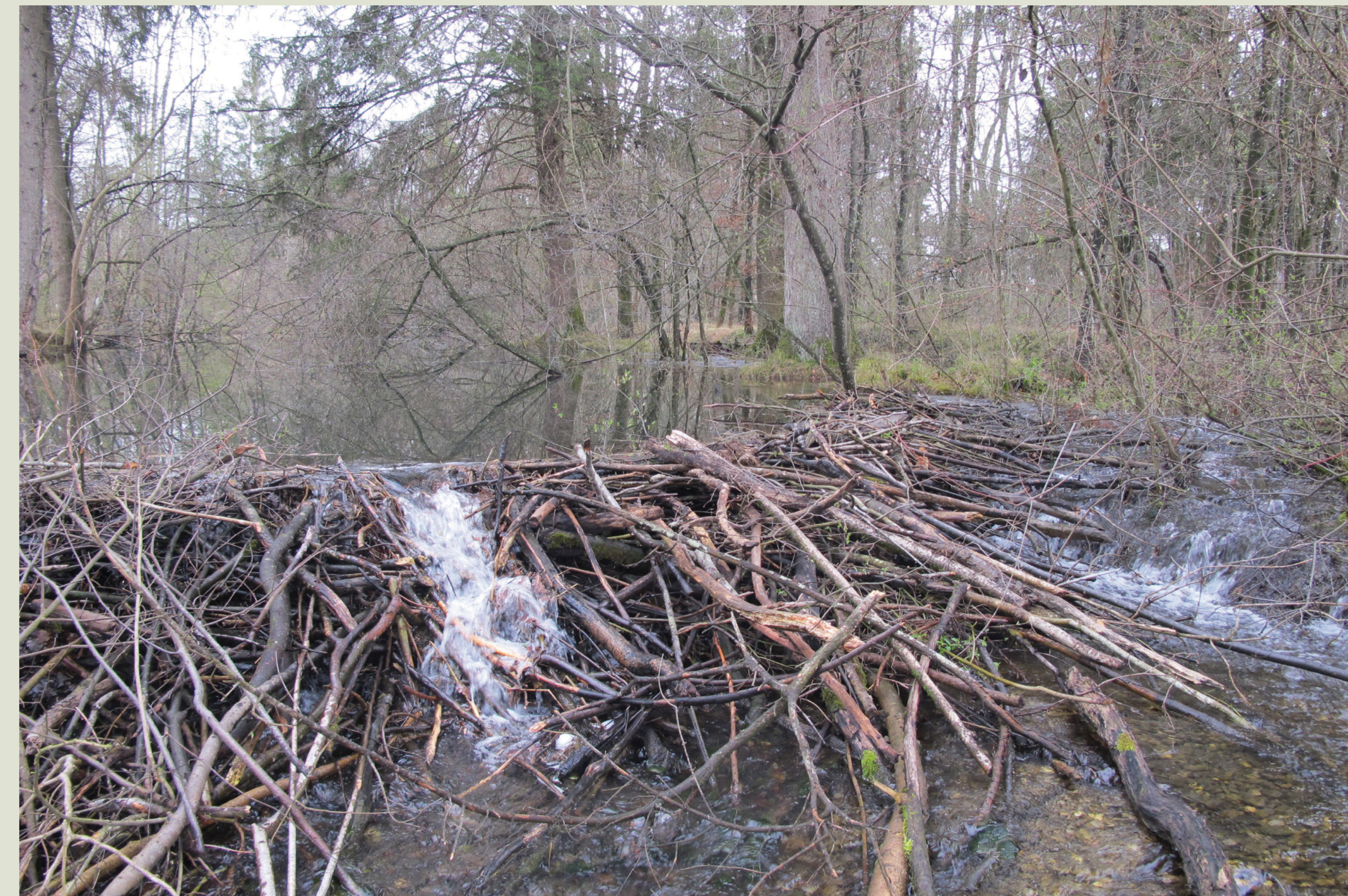
Bevorzugt bewohnt der Biber Gewässer mit mindestens 60 cm Wasserstand. Ist dies nicht der Fall, baut der tüchtige Baumeister mit Astmaterial einen Biberdamm.

Periodisch überschwemmte Weichholzaunenwälder beherbergen schnell wachsende und weiche Holzarten wie Silberweiden und Schwarzpappeln. Diese Pflanzenarten ertragen es gut,