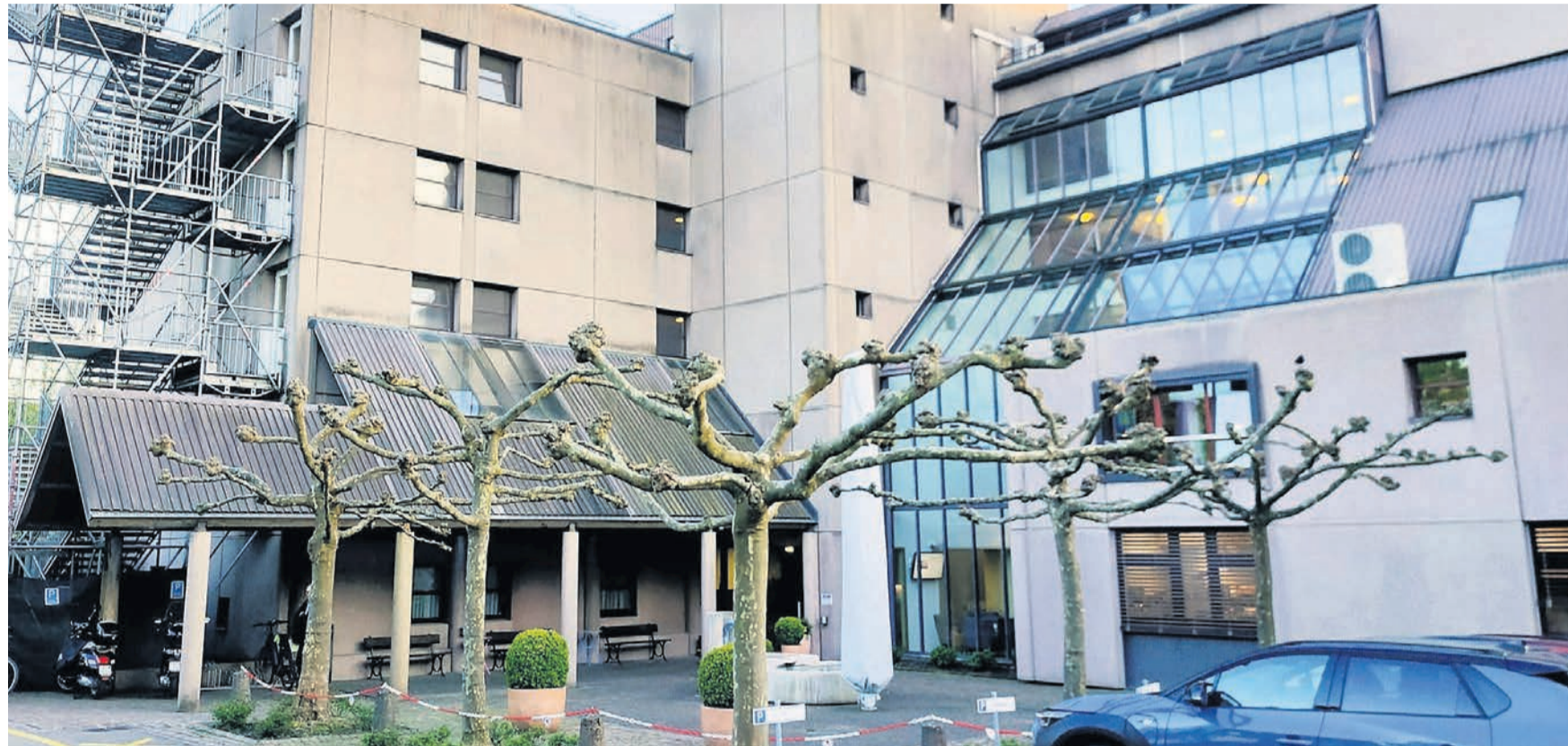
Bei der Planung des Um- und Neubaus des Alterszentrums Bärenmatt geht der Vorstand nochmals über die Bücher.