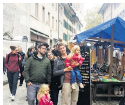
Die Bremgartner Geschäfte würden am Markt der Vielfalt gerne öffnen.