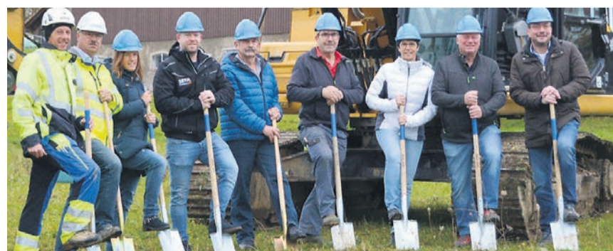
Alle packen beim Spatenstich für die zwei Mehrfamilienhäuser im Unterdorf kräftig mit an.