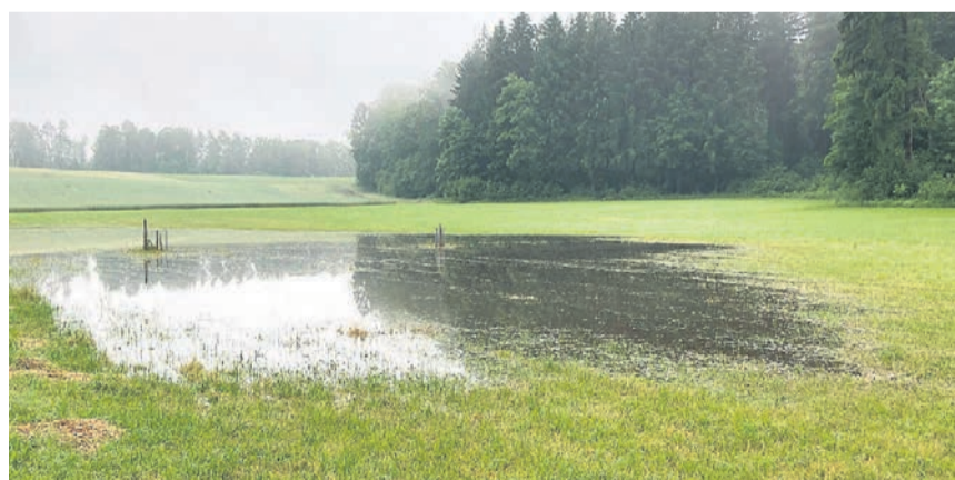
Nach starken Regenfällen liegt im Gebiet Fischächer bereits heute oft Wasser. Jetzt werden dort Weiher gebaut.