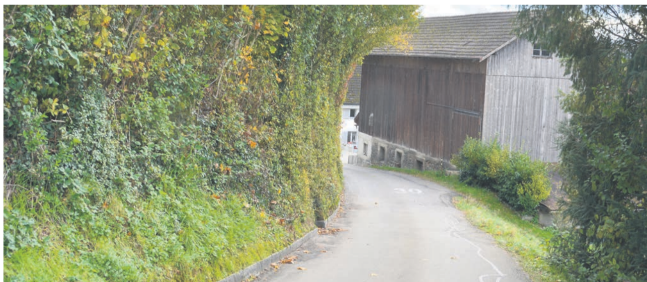
Die Kirchrainstrasse ist bereits heute eng. Nach der Sanierung soll sie vor der Scheune verbreitert werden. Der Bereich der Scheune bleibt aber auch künftig ein Nadelöhr.