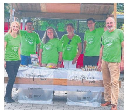
Die NUK stellte sich mit einem Stand vor.