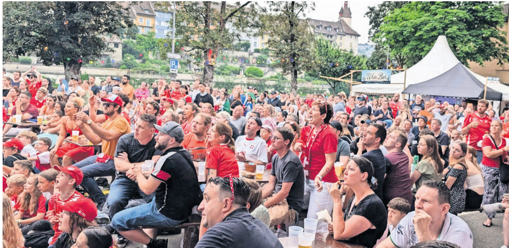
Fussball-Sternstunden am Reussufer: Das Nati-Highlight des Jahres fügte sich wunderbar ins ohnehin mit vielen Höhepunkten befrachtete Programm.

Auf der Burkertsmatt in Widen fand der erste Axa-Cup statt. Beim FC Mutschellen ist man mit dem Turnier zufrieden. Seite 17