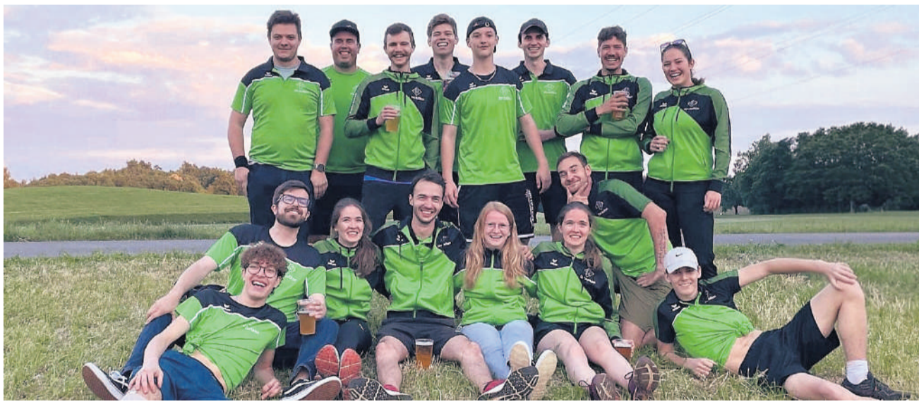
Zwei Teams, ein Ziel: Spass, Sport und Zusammenhalt.

Für die Aargauer Natur wünscht sich der Eggenwiler, dass die Öffentlichkeit künftig mehr schätzt, wie schön diese Natur im Kanton ist. «Und dass sich die Einwohnerinnen und Einwohner für deren Schutz einsetzen – egal, was es kostet.»