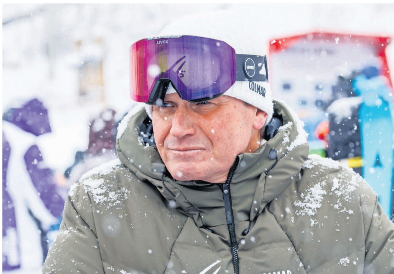
Er war in verschiedenen Funktionen schon an zahlreichen Ausgaben der Olympischen Spiele vor Ort. Jetzt ist er zum ersten Mal als CEO des Internationalen Skiverbandes FIS: Urs Lehmann.

Der 56-Jährige aus Oberwi-Lieli ist CEO des Internationalen Skiverbandes (FIS). Mit Ausnahme des Biathlons trägt der Weltverband die Verantwortung für den sportlichen Ablauf sämtlicher