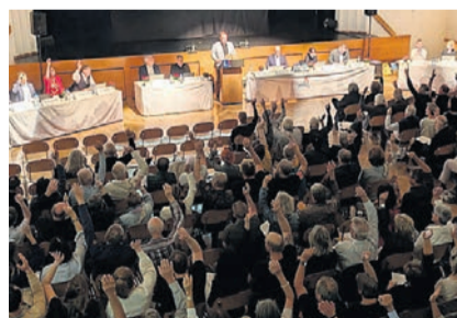
Zumeist war man sich einig.